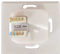
KRONE-Adapter zu TAB10s